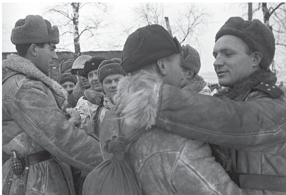
Встреча бойцов Волховского и Ленинградского фронтов в районе рабочего посёлка № 1 во время операции по прорыву блокады Ленинграда.